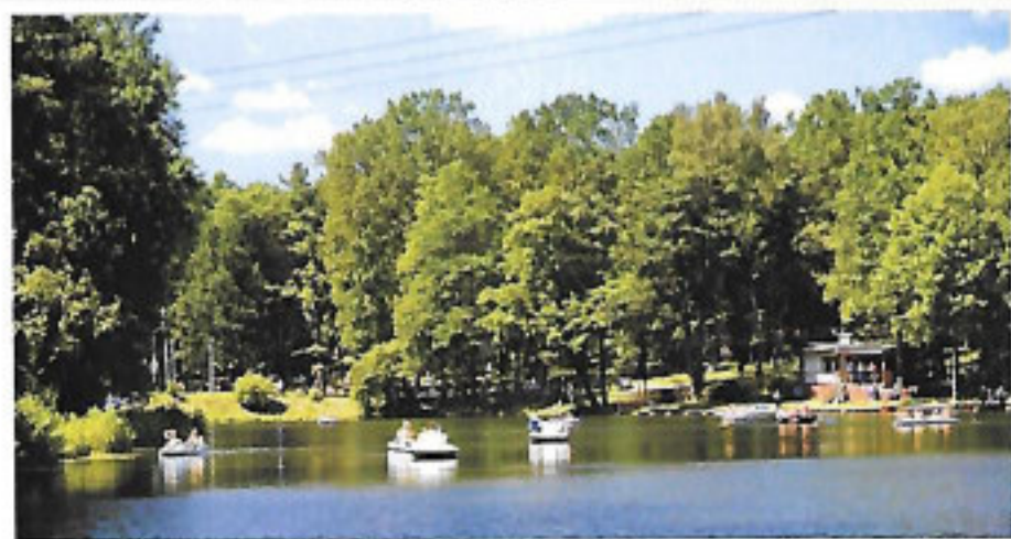
4) Arturówek - Camping Camping und Erholungsort