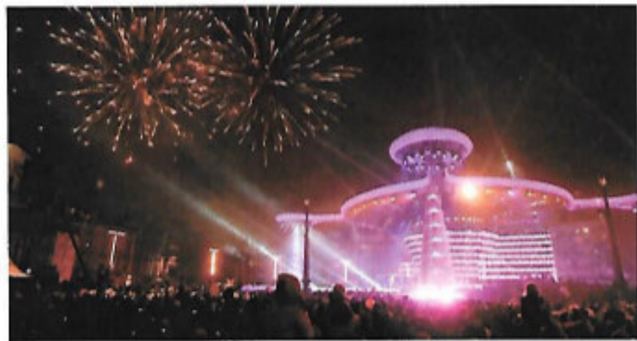
3) Freiheitsplatz Konzertort